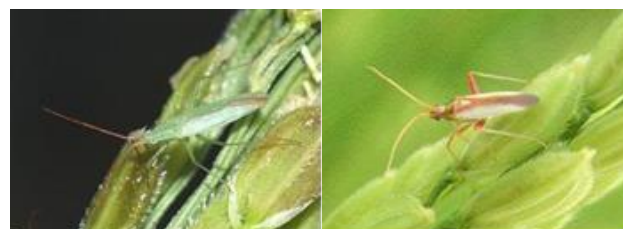
アカヒゲホソミドリカスミカメ アカスジカスミカメ