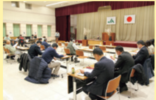
協議を行う参加者

なることが予想されるため、規格を確認し高品質のタラの芽の出荷を目指して「目ぞろえ」と部会員に呼び掛けました。