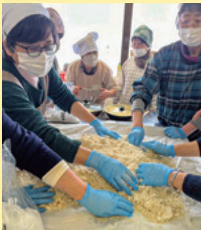
味噌作りを楽しむ部員ら