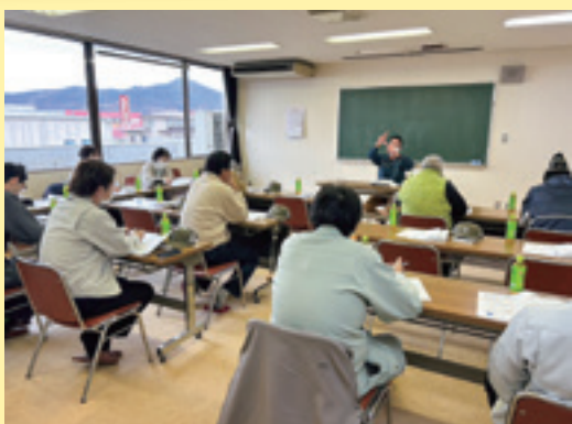
説明を聞き、意見交換する参加者