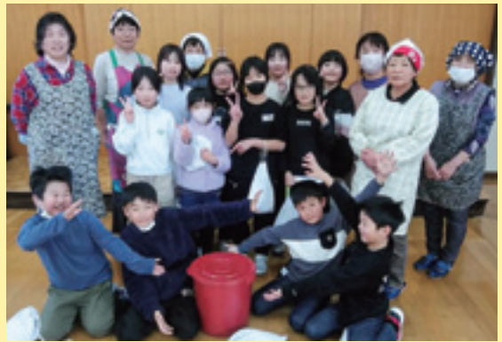
味噌玉が完成して喜ぶ参加者

J A女性部米沢北支部六郷班は1月26日、米沢市立六郷小学校3・4年生を対象とした農業総合学習を行いました。今年度は昨年6月に女性部員の圃場（ほじょう）で、一緒に植え付けた秘伝豆を味噌に加工する作業を行いました。参加した児童はやわらかく煮た豆と手作りのつや姫麴をビニール袋でつぶし、天然塩を混ぜ合わせ味噌玉を作る工程を行い、最後に全員で熟成させるために味噌樽に入れました。参加した女性部員は「今後も地元食材の素晴らしさを子供たちに伝える活動を継続していきたい」と話しました。