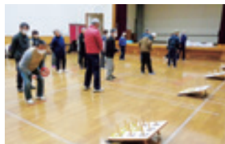
◁ 鮎貝地区ワナゲ大会

1月23日に鮎貝地区、1月27日に東根地区にてワナゲ大会を行いました。鮎貝地区年金友の会では、令和元年度大会がコロナウイルス感染防止のため中止になって以降、久しぶりの開催となりました。今大会は最高齢90歳の選手を筆頭に29名の選手によって競技が行われ、2メートル先の得点棒に入らず歓声やため息の聞こえる中、地区内の大会ではなかなか出ないパーフェクト達成者も出て、会場は大いに盛り上がりました。