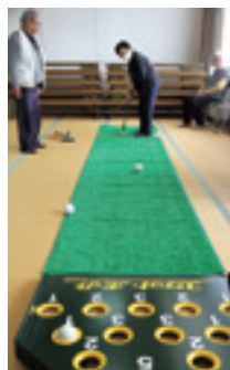
△得点穴を狙う参加者

1月25日にJA旧赤湯出張所で、赤湯地区年金友の会ワナゲ・スカットボール大会を行いました。2月中旬に南陽地区全体のワナゲ大会を予定しており、参加者は大会のルールに沿って真剣に取り組みました。ワナゲと並行して行ったスカットボールはスティックで打って得点穴に入れるゲームですが、狙ったところに入りそうで入らないこともあり、参加者からは「おいしい!」「やった!」などの歓声が起こり盛り上がりました。