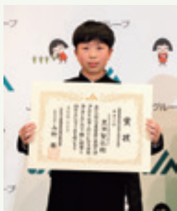
賞状を手に持つ黒澤くん