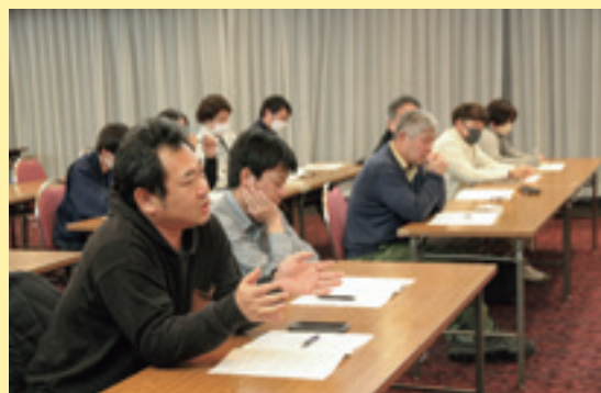
意見を交わす参加者

J Aもも振興部会は1月22日、南陽市の熊野大社證誠殿で出荷反省会を開き、販売実績や市場から産地への要望について情報を共有しました。今年度のおきたま産のももは、気象の影響で核割れ果や変形果などが見られましたが、結果は良好で全体的に小玉傾向であったものの安定した品質で出荷されました。出荷数量71ト(前年度対比95・9%)、平均単価578円(同対比118・7%)、販売金額4151万4099円(同対比113・9%)と前年度を上回る販売実績となりました。