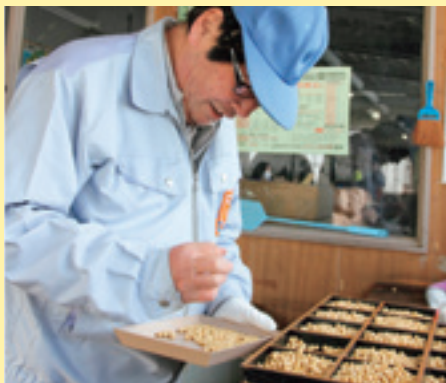
大豆の格付けを行う大豆検査員