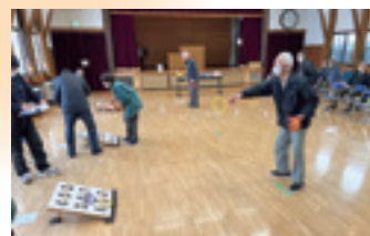
東根地区ワナゲ大会▷