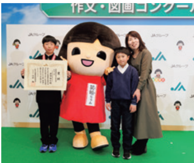
受賞を喜ぶ黒澤くんのご家族

米作りの作業は、ほぼ機械を使わずに手作業で行ったので大変でしたが、作業をやり終えた後に見る田んぼの景色と達成感は疲れを忘れるほど気持ち良かったです。お米一粒に農家の皆さんの努力と愛情が沢山詰まっていたことを改めて実感できました。この作文を読んで、おいしいお米や農産物を作る農家の皆さんへの感謝の気持ちと、食への関心を持つ人が少しでも増えたら嬉しいです。