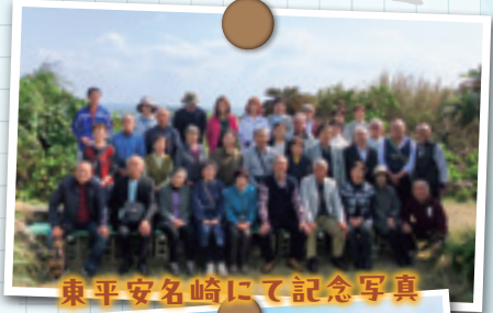
東平安名崎にて記念写真