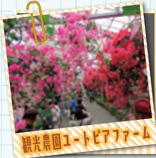
観光農園ユートピアファーム