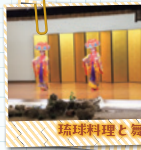
琉球料理と舞踊を楽しみました