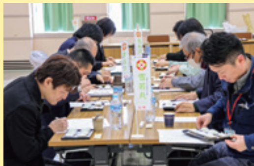
食味審査を行う審査員