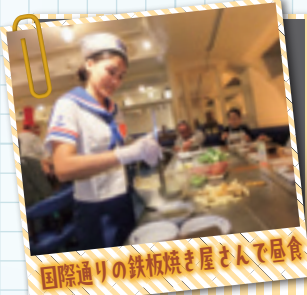
国際通りの鉄板焼き屋さんで昼食