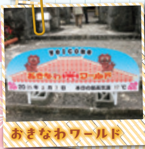
おきなわワールド