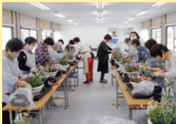
花の寄せ植えをする部員たち

J A白鷹地区女性部は5月21日、旧白鷹愛菜館で今年度1回目の花教室を開催し、部員12人が参加しました。 参加した部員たちは鉢の中に植物の高さや、色のバランスよく植えることを考え、様々な方向から眺めながら、花の寄せ植えを和気あいあいと楽しみました。 今後も花ショップポピーさんを講師に迎え、季節の花を使った寄せ植えを定期的に開催する予定です。