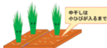
品種別目標茎数の目安