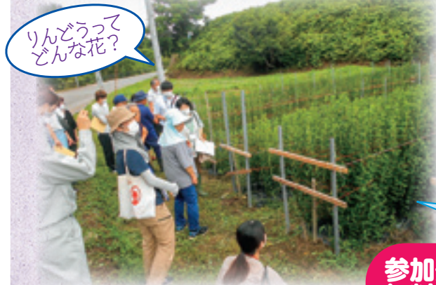
令和5年7月12日りんどう圃場見学会の様子