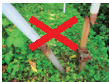
さびて折れたパイプ、さびたクランプ