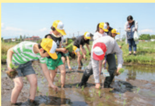
田植え体験をする児童ら

6月1日、J A 南陽支店で第21回を迎える「ちゃぐりんキッズクラブ」開校式と第1回授業が開催され、生徒24人が入校しました。授業では田植えとほたち作り体験を実施し、素足で田んぼに入った生徒からは、「温かくて気持ちいい」などの声が上がりました。 ひとつひとつの苗を丁寧に植えました。 第2回の授業は6月29日、農産物の収穫体験と花の寄せ植え体験が予定されています。