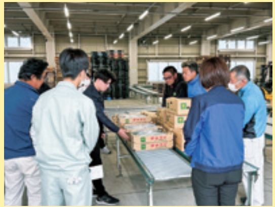
意見を交える部会員と職員

J A きゅうり振興部会は5月17日、南陽市の広域集出荷施設で「令和6年度半促成きゅうり出荷目ぞろえ会」を開きました。同部会では、選果機利用により出荷規格に準じ、品質規格の高位平準化に努め、販売ロットの拡大を図っています。目ぞろえ会では、現在選果している現物を並べて、等階級別に曲がり、大きさなどの出荷基準や袋の詰め方について確認しました。また、J A 担当者から令和6年産の販売状況や他県産の出荷状況、現在の販売市況が報告され、選果ラインの利用と取扱要領について協議しました。