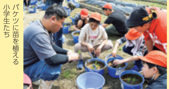
バケツに苗を植える小学生たち