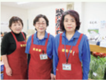
米沢愛菜館 店舗担当の皆さん

5月は山菜が多く並び、山菜を目当てに多くのお客様がいらっしゃいました。午前中には売り切れてしまう程の人気でした。米沢愛菜館には薬物野菜が多く並びます。ブロッコリーやアスパラガスその他、二十日大根やサラダカブも大変人気です。7月からお盆に掛けて、色鮮やかなアルストロメリアの切花が店内を彩ります。皆様のご来店をお待ちしております。