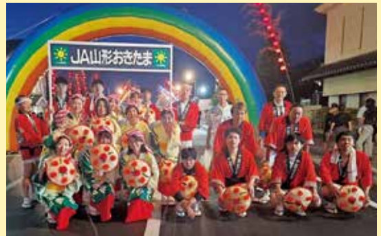
民謡パレードの参加者

高島町で8月15日と16日の2日間、第58回たかはた夏祭りが開催され、高島地区の役員が民謡パレードに参加しました。 この祭りは、町内にある安久津八幡の神輿を青竹にちようちんをつけて送迎したのが始まりとされており、「青竹ちようちんまつり」とも呼ばれる高島町の夏の伝統行事になっています。 J Aたかはた支店では毎年この祭りに参加しており、16日の民謡パレードでは役員が踊りながら町を練り歩き祭りを盛り上げました。