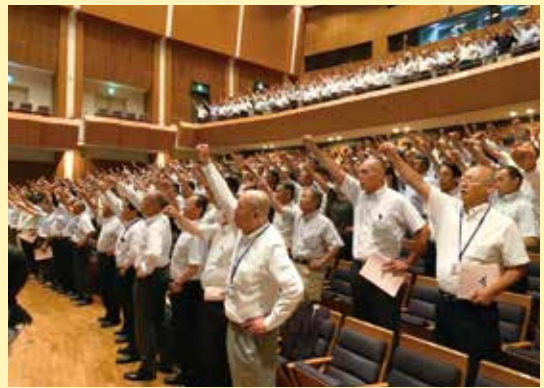
ガンバロー三唱する参加者

WEB視聴者を合わせて約1000人が参加し、会場には当JAから組合員、役員員合わせて96名が出席しました。要請集会では、食料・農業・農村基本計画の見直しについて、再生産に配慮された適正な価格形成の仕組みの法制化や経営所得安定対策等の拡充など体系的な見直しを要請しました。また7月の記録的な豪雨において、庄内、最上地域を中心に農産物や農地、また農業用施設等に甚大な被害が発生したことに対し、JAグループとして支援対策を講じるとともに政府に対しても被災者の営農継続、早期復旧への支援を働きかけるよう強く要請しました。