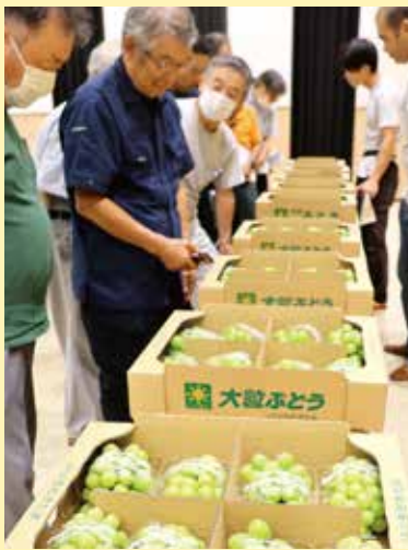
出荷規格を確認する部会員

J A大粒ぶどう振興部会は9月4日、たかはた支店と南陽支店でシャインマスカット出荷目ぞろえ会を開きました。 目ぞろえ会では、生育状況や販売計画などをJ A担当職員が説明し、冬季販売の取り組みについては、生産者の手取り向上とブランド産地確立を目指し、高鮮度冷蔵庫を活用したJ A買取販売並びに貯蔵販売の拡大を呼び掛けました。 その後、部会員は現物を直接見ながら出荷規格や荷姿などについて確認しました。