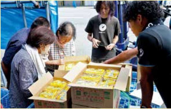
現物を確認する部会員

J A食用菊振興部会は8月19日、川西一次集荷場で食用菊現地出荷規格目ぞろえ会を開きました。 目ぞろえ会では食用菊の現物を手に取り選別基準やパック詰めの方法を中心に確認しました。目ぞろえ会後は、部会員の圃場を巡回し、現在の生育状況と今後の栽培管理について意見を交わしました。 おきたま産の食用菊については前年より6日遅い8月1日から出荷が開始されており、最需要期となる9月の節句に向けて出荷計画を勘案しながら有利販売に努めていきます。