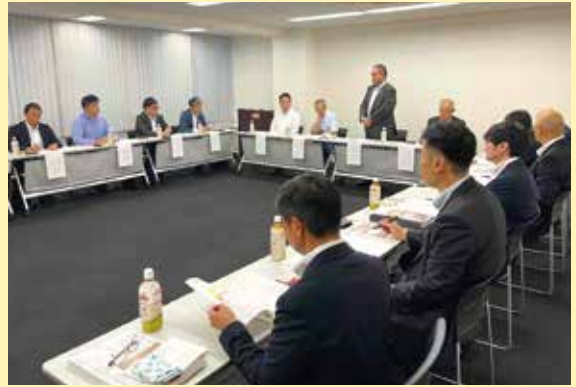
挨拶する若林組合長

8月5日、東京都内で米穀事業山形おきたま会の第25回通常総会が開催され、会員であるおきたま米の主要取引先7社やJA役員ら20名が出席しました。 当会は、会員相互に事業発展とおきたま地域農業の発展に寄与することを目的としており、総会では米穀情勢や消費地における販売状況、今後の見通しなどが報告されました。 総会後に行われた意見交換会では、卸売業者から高温少雨による品質および収量の低下や離農による生産量の減少への不安、生産を支える対策などについて話し合われました。