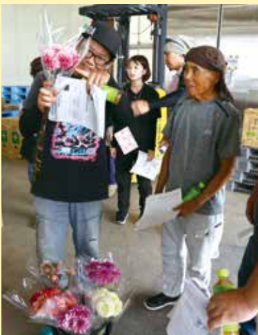
意見を交わす参加者

JAダリア振興部会は8月22日、川西町の川西一次集荷場で出荷目ぞろえ会を開きました。 JA担当者から検査基準や出荷時の留意事項について説明があったほか、農業技術普及課より排水対策や病虫害防除などの圃場管理、高温による品質低下への注意喚起がありました。 その後の目ぞろえ会では、現物を手に取りながら検査時のチェック項目などについて参加者たちが意見を交わしました。