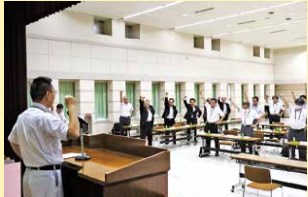
目標必達に向けて頑張ろう三唱を行う参加者

J Aは8月28日、本店で、J A役員やJ A全農山形県本部職員を集め「かたらい訪問一斉運動」目標必達大会を開きました。 今年度は肥料で12億6200万円、農薬は6億7100万円の目標を掲げ、推進体制や取扱奨励措置について確認しました。 当J Aでは「かたらい訪問一斉運動」を展開して生産者への安定供給を図り、令和7年2月までに、肥料・農薬を予約申込頂いた生産者に対して奨励措置を設けコスト低減に向けた支援を行います。