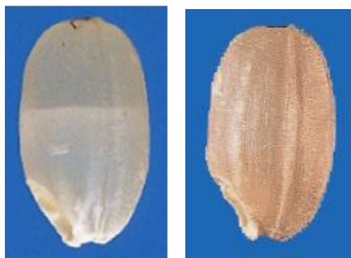
図1 左：胴割粒 右：着色粒 (農林水産省HP)