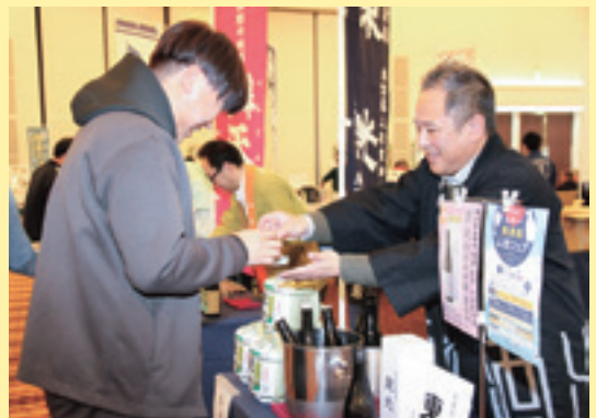
酒蔵ブースの担当者から商品の紹介を聞く参加者

J Aと県、管内の3市5町で組織されるおきたま食のモデル地域実行協議会は2月17日、米沢市のグランドホクヨウで「第8回おきたま地酒サミット」を開催しました。J Aグループ役員や地域住民、観光客など約180人が参加し、管内14歳の地酒の試飲や置賜地域の農産物を使用した料理を楽しみながら地域の魅力を伝える企画イベントが行われました。会場内には全28種の銘柄が用意され、参加者は地酒や地元食材の料理とともに置賜地域の魅力を堪能しました。