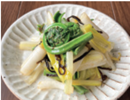
(一人当たりの塩分量 0.5g)