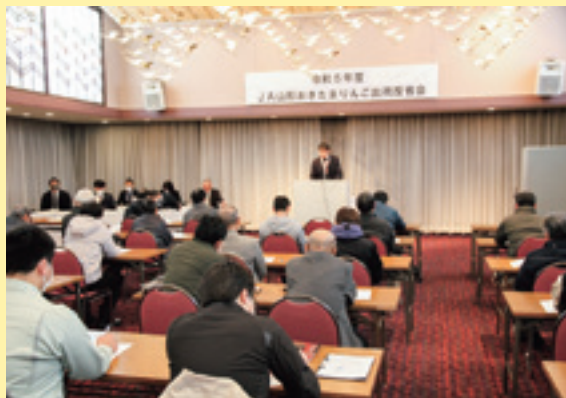
次年度に向けて対策を検討する参加者

J Aりんご振興部会は2月8日、南陽市の熊野大社證誠殿で出荷反省会を開き、生産者やJ A役員、市場担当者など約50人が集まりました。2023年産りんごは、凍霜害や猛暑による着色遅延や日焼け、実割れなどが発生し、出荷数量の低下に大きく影響しました。J Aでは次年度に向けて、SNSを利用した迅速な情報発信や日ごろの会合などを継続して行い、輸送問題へ対応した搬入計画の精度向上と選果体制の強化を図るなど対策を検討しました。