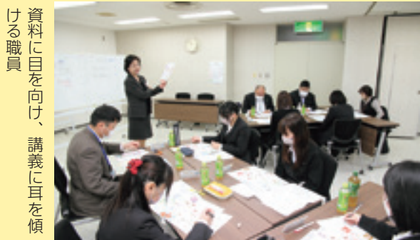
資料に目を向け、講義に耳を傾ける職員