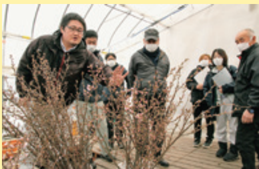
成長調整剤を使用した啓翁桜を 確認し意見を交わす部会員ら