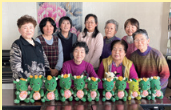
完成した作品に大満足の女性部員

J A川西地区中郡女性部は2月1日と15日に「手芸教室」を実施し、今年の干支「龍」をモチーフとした「あみぐるみ」を製作しました。J Aカラーの緑の龍は、毛糸とかぎ針を使用して一人ひとりかわいらしい出来栄になりました。中郡女性部では、毎年その年の干支を編んで家族の健康や繁栄、そして平和を願っています。教室内では、細かな作業をみんなで教え合いながら会話が花が咲き、「今後も寒い時期の楽しみとして、集まって干支製作を継続していきたい」と語りました。