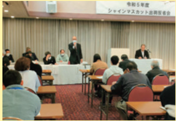
市場担当者の話を聞く部会員ら

J A大粒ぶどう振興部会は2月16日、南陽市の熊野大社證誠殿で出荷反省会を開き、今年度の生育や販売実績を振り返り、次年度に向けた課題と対策を協議しました。今年度は大粒ブドウ全般に果粒肥大が良好で大房傾向でした。特に「シャインマスカット」は、一部園地では高温による影響を受けましたが、出荷ピークとなった10月4日は日量5.4トとなり、前年の倍以上の日量で10月末まで連日出荷となりました。