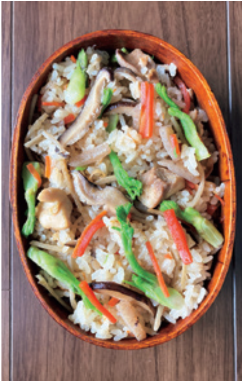
(1人当たりの塩分量1.5g)