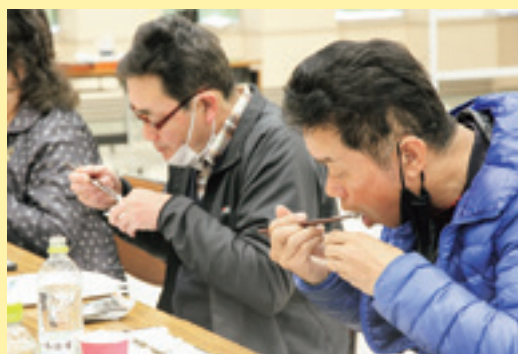
試食を行う審査員

J AとJ A稲作振興会は2月9日、本店で二次審査会を開き、稲作振興会役員やJ A女性部、J A役員ら約40人が審査員を務めました。一次審査の食味関連成分や品質判定機による玄米品質、書類審査などで選出された「つや姫」「雪若丸」「はえぬぎ」の3品種の試食を行い、外観や香り、味、粘り、硬さなどで総合的な評価を審査しました。審査員は「どの米も食味が良く、甲乙つけがたい」と話し、一口ずつ吟味しました。